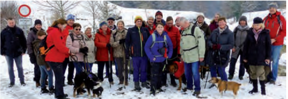
Bergab in Richtung Reisenthal